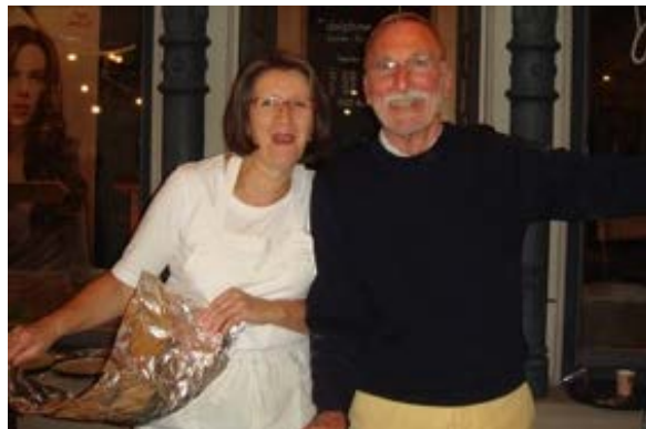
Une spécialité ajoulote vient en aide aux enfants malades en Arménie

Pendant les trois journées de la Braderie, une cinquantaine de « semristes » se sont relayés pour préparer, découper et vendre ce gâteau aux patates désormais entré dans la légende de SEMRA PLUS . 44 heures de labeur intense magnifiquement récompensées par la cordialité qui a régné dans l'équipe, par l'intérêt et la générosité du public et par le succès considérable obtenu. 1'500 gâteaux confectionnés, vendus et dégustés ; un bénéfice pour SEMRA PLUS d'environ CHF 15'000.-. Le record d'il y a deux ans est battu ! Le gâteau aux patates a de nouveau « fait un malheur » !