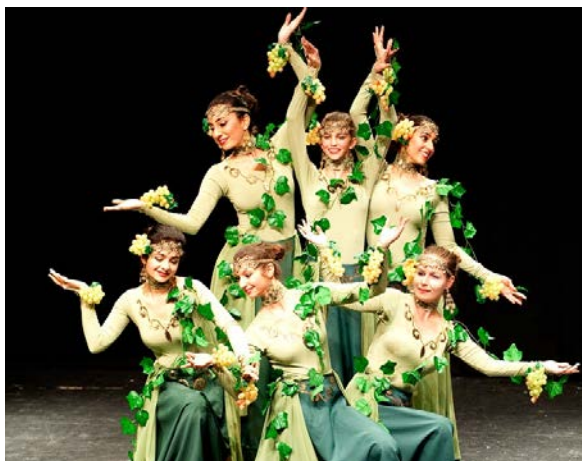
Sanahin : mémoire du folklore arménien