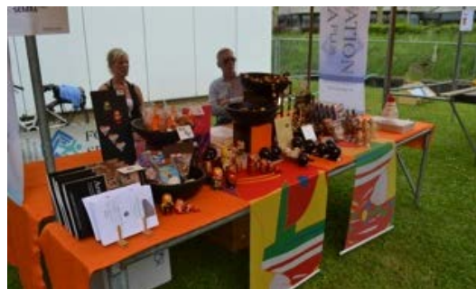
Faire connaître SEMRA PLUS et l'Arménie d'aujourd'hui

Tout au long de la Fête de la Solidarité organisée le 7 juin par la Fédération Interjurassienne de Coopération et de Développement dans le cadre du Collège Saint-Charles, plusieurs militant-e-s de SEMRA PLUS ont tenu un stand qui, tout en proposant des objets d'artisanat arménien, a informé le public sur les buts et les activités de notre association. Une opération de « relations publiques » fructueuse !