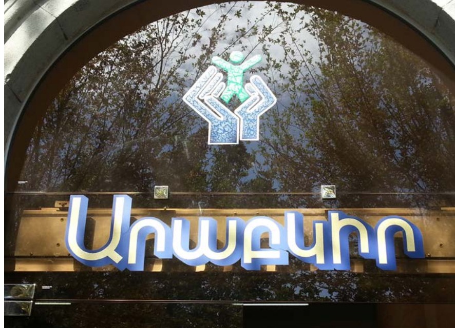
Portail d'entrée de l'Hôpital ARABKIR à Erevan Votre première leçon d'alphabet arménien a majuscule, r, a minuscule, b, k, i, r