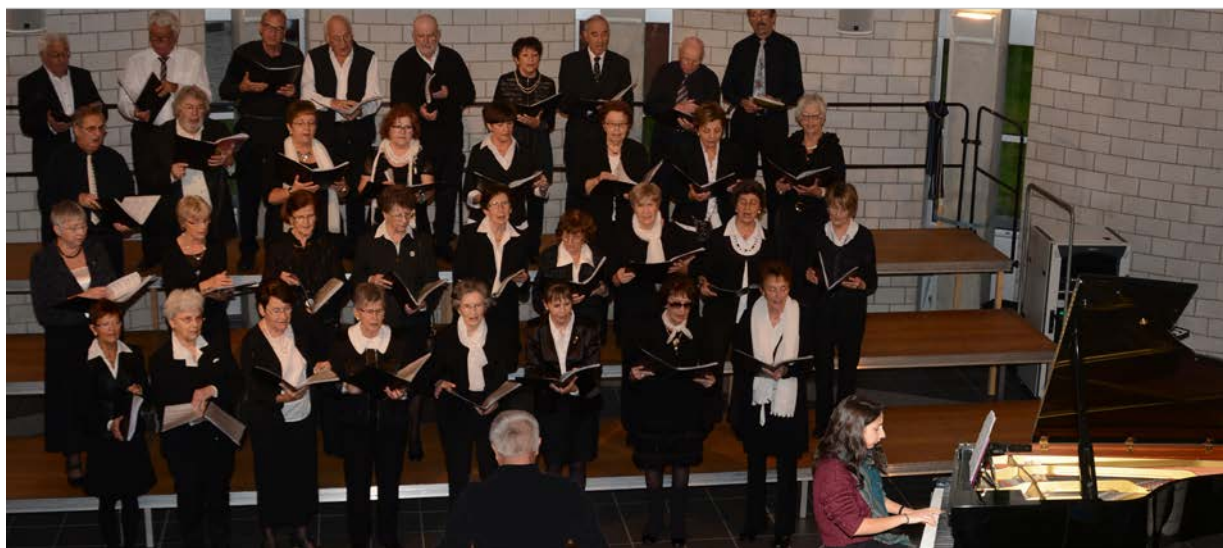
Les voix de la solidarité et de la générosité